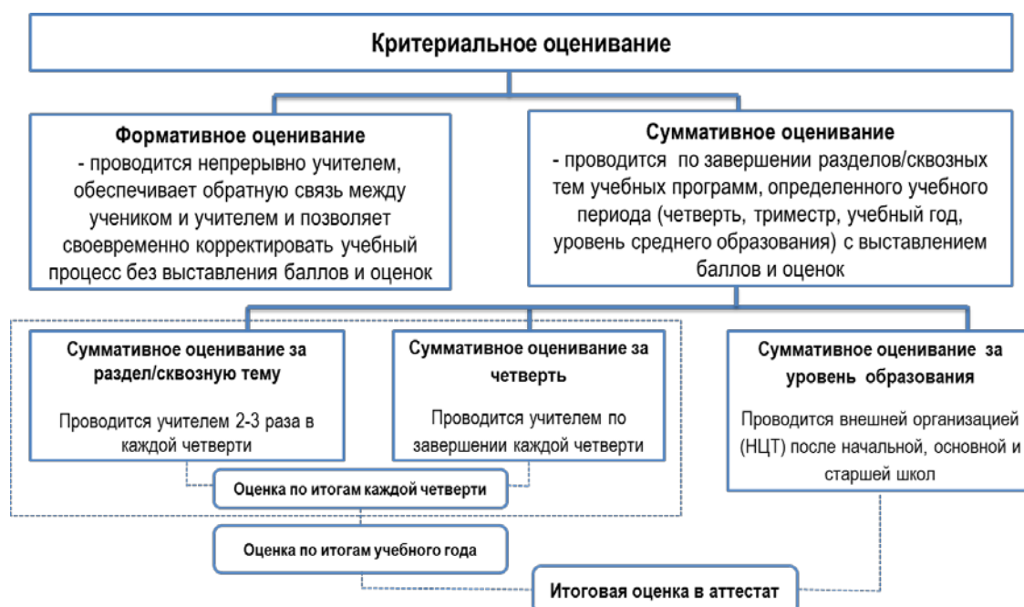
Рисунок 2– Структура критериального оценивания

Для сбора данных об успеваемости и прогрессе в обучении в течение учебного года осуществляются два вида оценивания: формативное оценивание и суммативное оценивание. Суммативное оценивание, в свою очередь, включает процедуры суммативного оценивания по разделу/сквозной теме, четверти и уровню среднего образования.